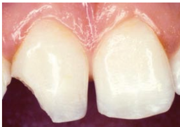
Ituslået fortand på en 14-årig pige.

Selv en ødelagt fortand kan i dag ofte bygges op med et pænt og holdbart plasthjørne, så en kronebehandling kan undgås.