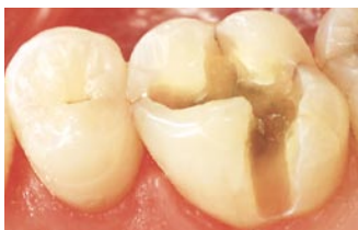
Caries er fjernet, og tanden er klar til en fyldning.

Det mest almindelige fyldningsmateriale, tandlægerne anvender i dag, er plast. Det har i mange år været anvendt til især fortænder, fordi det er tandfarvet. Men de materialemæssige egenskaber er nu blevet så gode, at plast i de fleste tilfælde også kan anvendes til fyldninger i kindtænder.