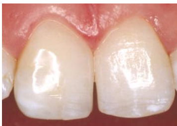
Samme fortand fem år efter, at tanden blev repareret med plast.

Plast limes til tanden og hærdes med en lampe. Der kan tygges straks efter, at fyldningen er lavet.