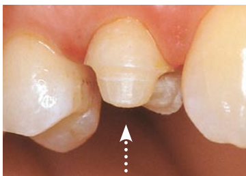
Tand slebet i form til et porcelænsindlæg.