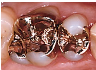
Begge kindtænder er behandlet med guldindlæg.

Guldindlæg eller guld-kroner bruges især til meget beskadigede tænder, hvor en fyldning i plast eller sølvamalgam ikke kan beskytte tanden godt nok.