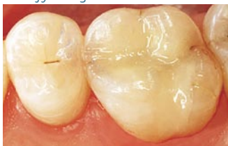
Lige efter at tanden er blevet behandlet med en plastfyldning.