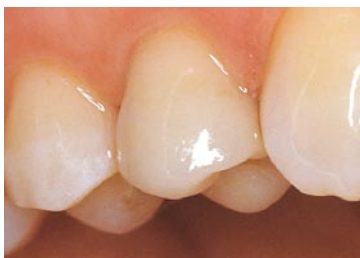
Samme tand med det færdige porcelænsindlæg.

De holder lidt bedre end plastindlæg, men selv om de har god holdbarhed, holder de ikke så længe som guldindlæg, fordi porcelænet er sprødt og kan knække. Porcelænsindlæg er på grund af den besværlige fremstillingsteknik ofte lige så dyre som guldindlæg. Porcelæn, som også kaldes keramik, er et meget stabilt materiale, som næsten alle kan tåle.